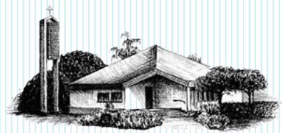
Ev. Kirchengemeinde Neumühl

Liebe Gemeindeglieder von Kork, Neumühl, Odelshofen und Querbach!